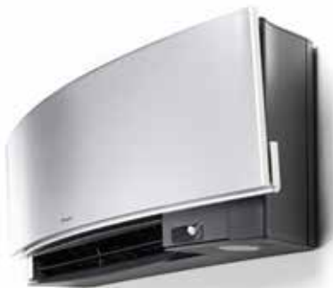
Низкий уровень шума – до 19 дБ(А)

Двухзонный датчик движения обеспечивает комфортные условия. Если в помещении никого нет в течение 20 минут, система изменяет установленное значение температуры, чтобы сократить потребление энергии. Как только кто-то входит в комнату, система немедленно возвращается в первоначальный режим работы. Датчик движения также направляет воздушный поток в сторону от людей во избежание сквозняков.