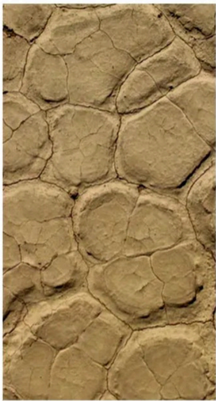
Местное сырье из ответственных источников