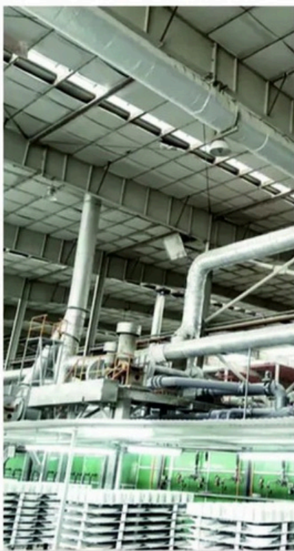
Повторное использование избыточного тепла от наших печей