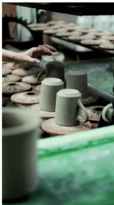
Собственный завод по переработке воды