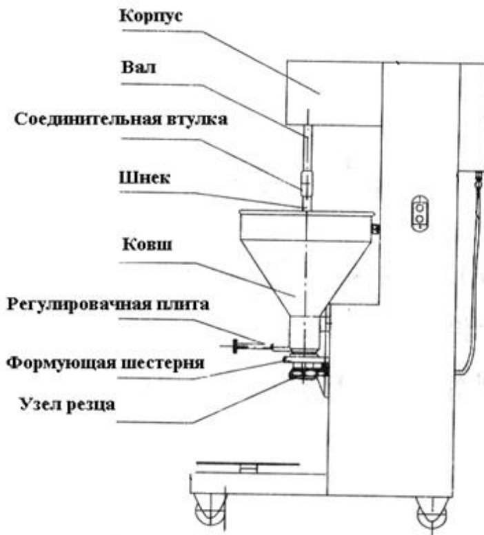
Рис. 1 Общие вид, основные элементы оборудования

Данное оборудование состоит из: корпуса, электродвигателя и механизма передачи (редуктор), серия валков и т.д. (смотрите рис. 1, рис. 2) (представленные эскизы могут отличаться от действительности, но основная компоновка оборудования не изменяется).